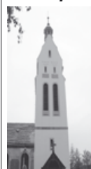
Malického v Lovosicích. Všichni jste srdečně zváni.

Náboženská obec Církve československé husitské v Lovosicích vás ve dnech 22.3. – 27.3.2010, denně od 10.00 do 17.00 zve na Jarní výstavu ručních prací. Tu můžete shlédnout v kostele v ulici Karla Malického v Lovosicích. Všichni jste srdečně zváni.